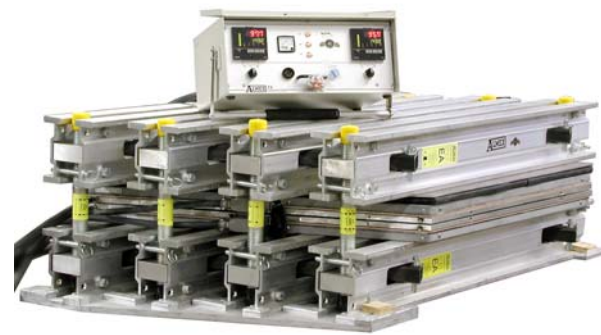
SVP 分段式 硫化机