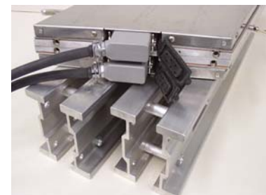
硫化板的嵌入式电气连接