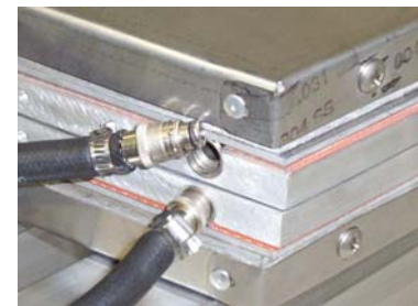
内置于硫化板中的冷却系统及其快速接头