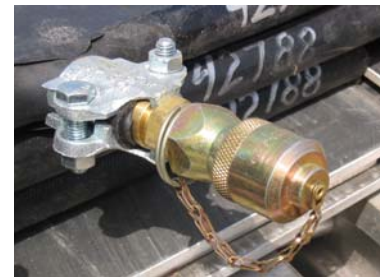
压力袋及其快速接头