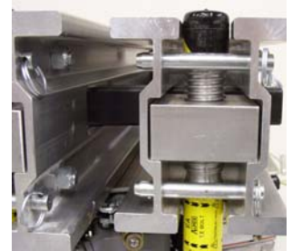
高强度合金E型横梁和螺栓螺母